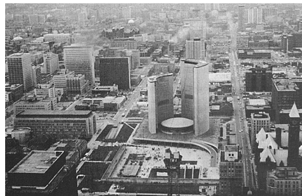
Foto van City Hall in het centrum van Toronto

ningsconcert in Grand Rapids op 21 april werd door meer dan 2500 mensen bezocht. Zeker zeshonderd mensen moesten wegens plaatsgebrek onverrichterzake naar huis terug. Onder hen waren er die zeker zes uur hadden moeten rijden...