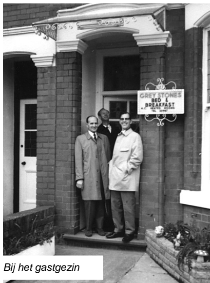
Bij het gastgezin

Vanmorgen om vijf uur begonnen de 450 Nederlanders in negen bussen aan de thuisreis. Dat betekende vannacht om vier uur leven in bijna vierhonderd Engelse gezinnen, want het overgrote deel van de koorleden was bij particulieren ondergebracht.